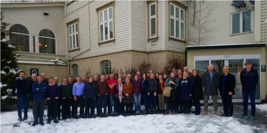
Bilde: BIOs lærersamling 2019, Voss.