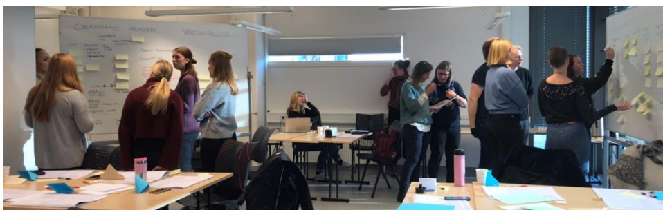
Bilde: Student workshop, BIO oktober 2019

Gjennomføringen av prosjektet gjøres i samspill mellom fagmiljøene, ledelse og studenter ved BIO, noe som gjenspeiles i redesignlagets (styringsgruppens) sammensetning. Som et av to pilotprosjekt for redesign av studieprogram ved UiB får styringsgruppen drahjelp av UiB Læringslab. Resultatene og erfaringene fra prosjektet vil være viktige for videreutvikling og tilpasning av utdanningstilbud, samtidig som prosessen utgjør et grunnlag for pågående utdanningsfaglig forskning ved bioCEED.